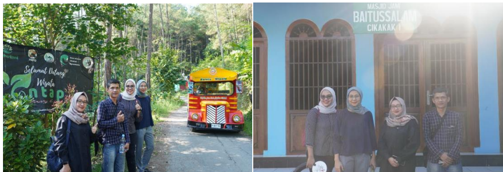
Gambar 2. Berkunjung ke unit usaha BUMDes

BUMDes Mitra Usaha Sejahtera. Pada awalnya dimana semua diberikan edukasi materi tentang digital marketing dilanjutkan dengan membuat video untuk promosi di media sosial. Hasil ini dilakukan untuk menunjukkan bawah kegiatan akan pentingnya digital marketing dan pembuatan video yang tepat sasaran dan dengan strategi yang baik dapat digunakan untuk memikat daya tarik wisata untuk unit-unit yang ada di BUMDes tersebut.