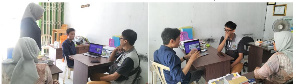
Gambar 1. Transferring kepada pengurus saat praktik pembuatan website

Penelitian dilaksanakan di BUMDes Mitra Usaha Sejahtera dari bulan Juli sampai dengan Agustus 2024. Kegiatan penelitian dimana terdiri dari dua tahapan yaitu pendampingan dan pelatihan. Pendampingan dan pelatihan dalam membuat konten marketing mempunyai tujuan agar pengelola BUMDes mempunyai kompetensi pengetahuan dan ketrampilan digitalisasi sistem laporan akuntansi keuangan mempunyai tujuan agar pengelola BUMDes memiliki pengetahuan dan keterampilan digitalisasi terutama mengenai branding dan membuat video konten promosi dalam bentuk video dan bentuk lainnya.