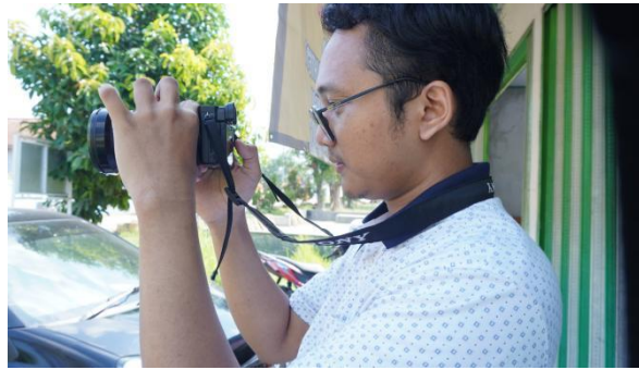
Gambar 3. Pelatihan langsung untuk mengambil foto konten