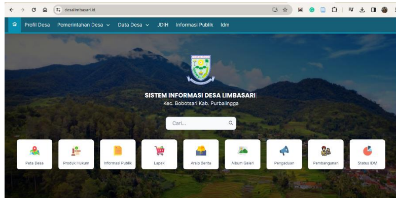
Gambar 2. Tampilan website https://desalimbasari.id/

"Pengembangan Sumber Daya Perdesaan dan Kearifan Lokal Berkelanjutan XIII" 17-18 Oktober 2023 Purwokerto