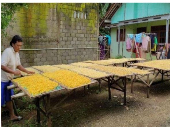
Gambar 3. Kegiatan Penjemuran Klatinting masih manual

Salah satu masalah yang dihadapi oleh KWT Cipto Roso dalam usahatan pengolahan klatinting adalah peralatan produksi yang masih sederhana serta ketergantungan proses penjemuran yang sangat bergantung langsung pada sinar matahari langsung. Proses penjemuran dibawah sinar matahari langsung tersebut berakibat pada keberlanjutan proses penjemuran terutama pada saat musim hujan serta saat cuaca mendung sehingga penjemuran tidak optimal. Oleh karena itu dalam kegiatan pengabdian masyarakat ini dilakukan indtroduksi rumah penjemuran dengan menggunakan plastik UV. Rumah penjemuran ini berukuran 8x20 meter dengan dua tingkat rak penjemuran. Dengan adanya tempat penjemuran seperti ini maka kegiatan penjemuran dapat dilakukan kapan saja bahkan pada saat hujan.