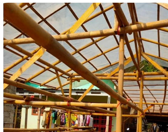
Gambar 4. Kegiatan Penjemuran Klatinting dengan menggunakan green house