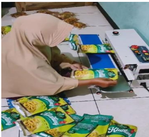
Gambar 5. Proses pengemasan klanting

Fungsi dasar kemasan adalah mendisplay produk, melindungi produk secara langsung agar tidak mudah rusak, fungsi ergonomis (agar mudah dibawa dan disimpan) dan fungsi komunikasi marketing. Proses pengemasan dan bentuk kemasan yang baik dapat menghambat proses kerusakan makanan, dan tentunya juga didukung oleh teknik penyimpanan dan pemasaran yang tepat. Pada kegiatan pengabdian ini, jenis kemasan klanting yang diintroduksi kepada KWT Cipto Roso adalah kemasan bahan plastik stand pouch menggunakan zipper dengan ukuran 30 x 40 cm. Kemasan ini diperkirakan akan mampu menampung 250 gram lanting. Dalam menunjang pengemasan tersebut juga diintroduksi peralatan pengemasan berupa continuous sealer mendukung pengemasan klanting agar bisa masuk pada pasar retail.