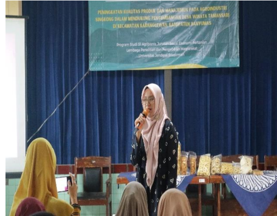
Gambar 2. Kegiatan Pendampingan Kelembagaan KWT Cipto Roso