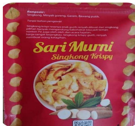
Gambar 6. Desain merek dan kemasan klanting KWT Cipto Roso