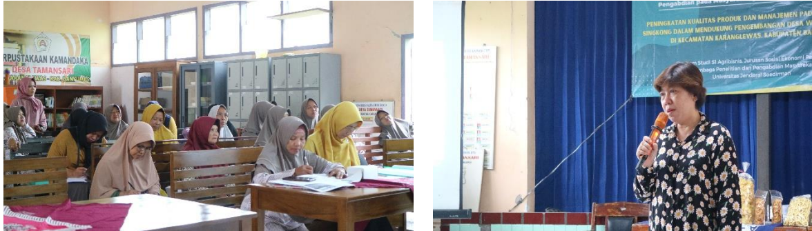
Gambar 7. Kegiatan pendampingan pencatatan keuangan dan penentuan penentuan harga pokok produksi

"Pengembangan Sumber Daya Perdesaan dan Kearifan Lokal Berkelanjutan XIII" 17-18 Oktober 2023 Purwokerto