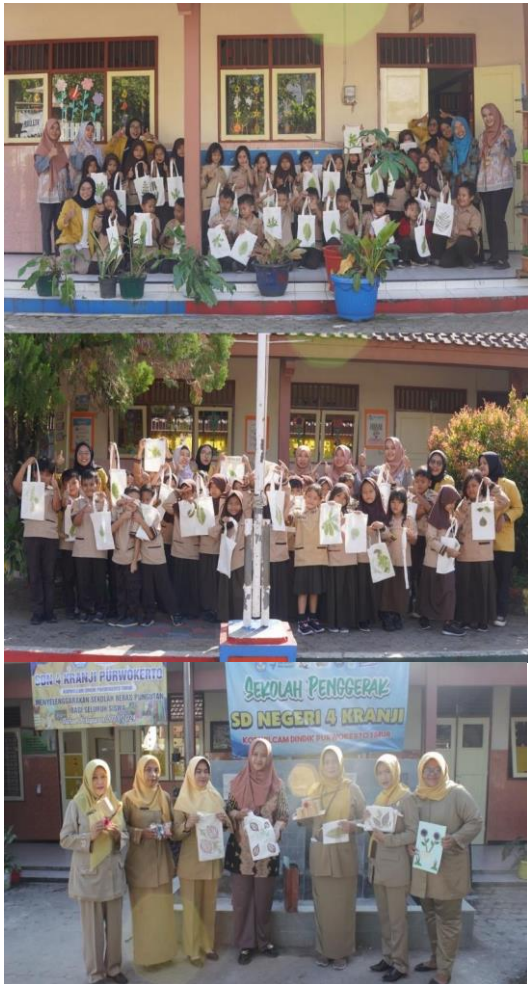
Gambar 7. Produk P5

Berdasarkan gambar, proyek aksi P5 yang dilakukan setiap kelompok berbeda-beda sesuai ide yang dimiliki. Proyek yang dibuat antara lain 1) membuat sabun kertas; 2) membuat totebag ecoprint dengan teknik pukul. Melalui aksi, dapat membentuk dan menguatkan karakter Profil Pelajar Pancasila yaitu kreatif, berpikir kritis dan bergotong royong. Selain itu, juga untuk membentuk karakter beriman, bertakwa kepada Tuhan Yang Maha Esa serta berakhlak mulia melalui pembiasaan-pembiasaan, membuang sampah pada tempatnya, dan kasih sayang terhadap teman. Hal ini sesuai dengan hakikat P5 yang tidak hanya berfokus pada produk yang dibuat tetapi peningkatan dan penguatan karakter secara berkelanjutan (Satria et al., 2022). Adapun salah satu produk hasil P5 dapat dilihat pada gambar 5 berikut.