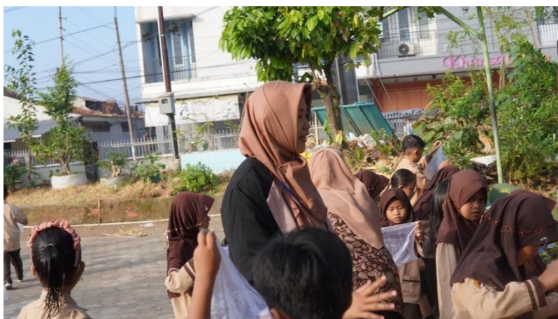
Gambar 4 Kegiatan kontekstualisasi di sekolah dengan mengamati keadaan sekitar

Tahap kontekstualisasi dilakukan dengan pengamatan terhadap lingkungan SD Negeri Kranji 4 Purwokerto. Peserta didik dibentuk secara berkelompok untuk melakukan pengamatan pada spot yang berbeda meliputi area ruang kelas, laboratorium, depan ruang guru, UKS, kantin, parkir, mushola, aula, dan ruang organisasi peserta didik. Adapun kegiatan kontekstualisasi dapat dilihat dari gambar 3 berikut.