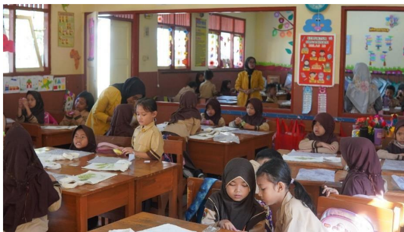
Gambar 3 Suasana Pelatihan Penyusunan Proyek Penguatan Profil Pelajar Pancasila Kurikulum Merdeka berupa Tas Ecoprint