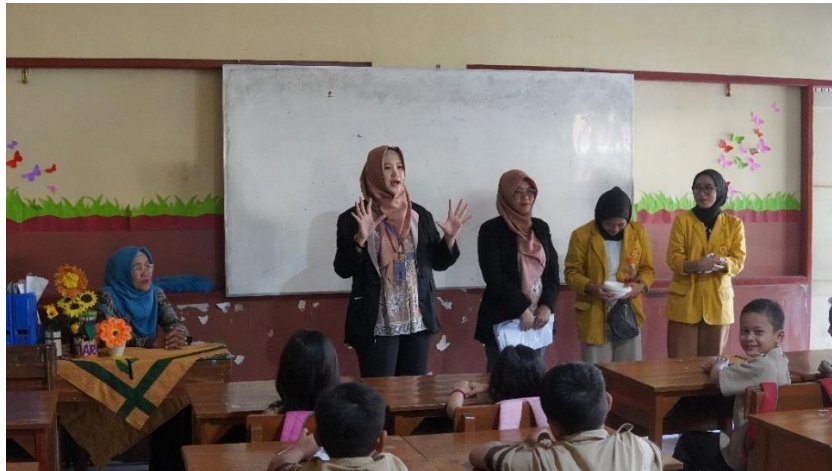
Gambar 2 Pembukaan Pelatihan oleh Kepala Sekolah dan Wali Kelas