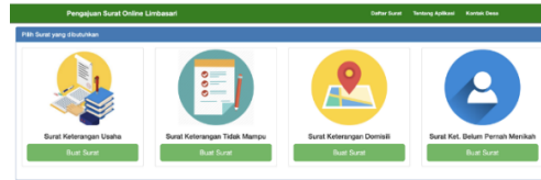
Gambar 1 . Halaman Awal Aplikasi Surat