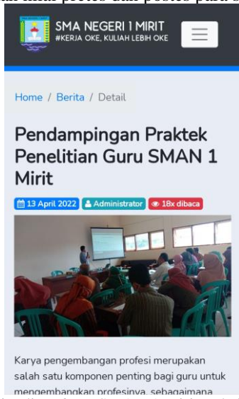
Gambar 6. Berita di Website SMAN 1 Mirit terkait Pendampingan Praktik Penelitian Guru

Manfaat lain dari pelatihan Model-Model Pembelajaran Inovatif ini adalah meningkatnya keterampilan guru dalam mengelola kelas dengan menggunakan model-model pembelajaran inovatif terbaru. Penguasaan guru atas model pembelajaran tersebut selanjutnya akan diimplementasikan di kelas untuk membelajarkan materi dengan pendekatan pembelajaran yang baru. Selanjutnya, pendekatan pembelajaran tersebut akan dilihat keefektifannya dengan membandingkan nilai pretes dan postes para siswa.