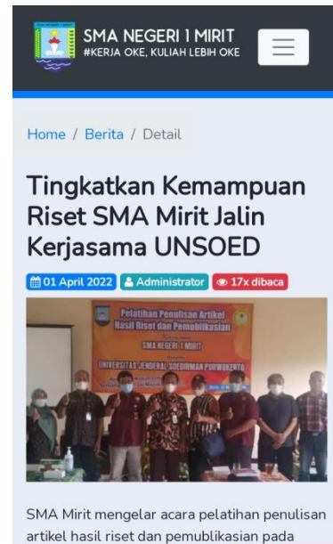
Gambar 2. Berita di Website SMAN 1 Mirit terkait Kerjasama antara Unsoed dengan SMAN 1 Mirit dalam Penumbuhan Kemampuan Riset Guru-Guru SMAN 1 Mirit

Tujuan utama dari keseluruhan pengabdian ini adalah memampukan para guru menghasilkan artikel ilmiah. Untuk itu, perlu didahului dengan sebuah riset yang dapat dengan mudah dikerjakan. Jika dalam pelaksanaan riset sudah ditemukan kendala, maka kemungkinan untuk menghasilkan artikel ilmiah menjadi kecil. Disain riset sederhana yang dikembangkan tim pengabdian diharapkan dapat menjadi obat yang mujarab untuk dapat melaksanakan penelitian dan menghasilkan artikel hasil penelitian. Pelaksanaan pengabdian sesi pertama ini juga dilaporkan dalam website sekolah (Gambar 2).