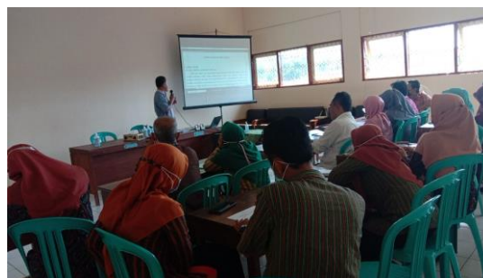
Gambar 5. Kegiatan pelatihan praktik model pembelajaran inovatif dengan pemateri Kepala Sekolah SMAN 1 Mirit

Program pengabdian ini mendapat dukungan yang sangat kuat dari Bapak Kepala Sekolah. Bentuk dukungan yang diberikan adalah dengan memberikan pelatihan kepada guru-guru tentang Pelatihan Praktik Model-Model Pembelajaran Inovatif (Gambar 5). Kegiatan ini dilaksanakan dalam tiga kali pertemuan dengan menjaring nilai pretes dan postes berturut-turut pada pertemuan pertama dan ketiga. Kedua nilai tersebut selanjutnya akan menjadi bahan analisis dalam pembuatan artikel. Dengan demikian, Kepala Sekolah juga berperan sebagai periset yang mengamati guru-guru.