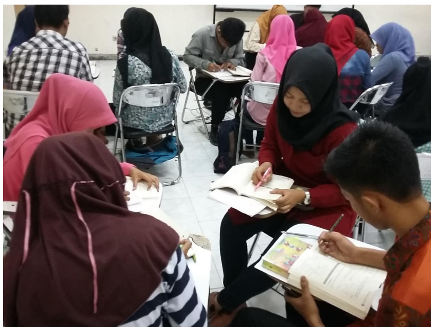
Gambar 3.2 Diskusi kelompok mata kuliah Geometri

Hasil belajar kognitif siswa dikumpulkan dengan memberikan 5 soal tes uraian. Setiap soal mempunyai penyelesaian dengan cara visual dan analisis. Sehingga untuk menyelesaikan soal 1 sampai dengan nomor 5 mahasiswa harus menggambar terlebih dahulu objek Geometri soal. Tahap tahap gambar ini diselidiki kemampuan mahasiswa dalam membuat visualisasi objek Geometri yang tepat sesuai teori level berpikir Van Hiele.