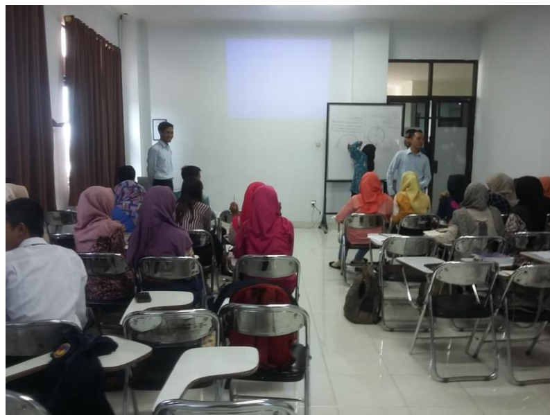
Gambar 3.1 Proses kegiatan pembelajaran mata kuliah Geometri

Proses pembelajaran pada mata kuliah Geometri dapat dilaksanakan dengan baik. Dosen dan mahasiswa dapat berinteraksi dengan baik. Mahasiswa cukup aktif dalam proses pembelajaran. Mahasiswa selalu berangkat kuliah selama satu semester, hanya ada 2 mahasiswa yang pernah izin tidak berangkat dikarenakan sakit. Sebanyak 19 mahasiswa sudah pernah bertanya pada proses pembelajaran mata kuliah Geometri.