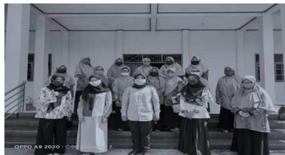
Gambar 4.1. Pelaksanaan Edukasi Kader Posyandu Lansia

Berdasarkan penelitian Rufiati et al., (2011) 70 % kader Posyandu Lansia memiliki pengetahuan yang kurang serta hanya 40 % kader yang pernah mendapatkan penyuluhan dari tenaga kesehatan. Sehingga tim pengabdian melakukan edukasi kepada kader terutama terkait