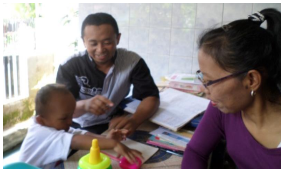
Gambar 11. Tim Pengabdian melakukan pendampingan dalam stimulasi tumbuh kembang balita