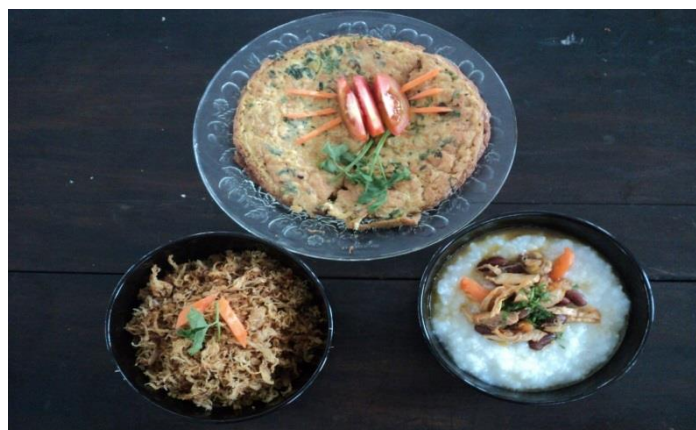
Gambar 6. PMT Balita hasil kreasi Kader Posyandu

Berdasarkan evaluasi kader juga dapat mendemonstrasikan pembuatan makanan tambahan untuk Balita. Contoh PMT balita yang dapat dibuat kader dapat dilihat digambar 6.