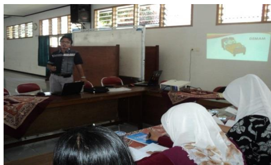
Gambar 5. Anggota 2 tim Pengabdian sedang menjelaskan penanganan awal masalah kesehatan balita

Masalah kesehatan yang sering dihadapi balita dan memerlukan penanganan segera antara lain: diare, demam, luka ringan, luka tersiram air panas dan lain sebagainya. Jika tidak ditangani dengan cara yang tepat dan cepat, masalah tersebut bisa berkembang menjadi lebih serius. Melalui pelatihan ini, kader-kader kesehatan akan diajari bagaimana cara penatalaksanaan awal masalah-masalah kesehatan tersebut sebelum mendapatkan pertolongan lebih lanjut di di Rumah Sakit atau layanan kesehatan lainnya. Untuk mempermudah pemahaman mereka, maka akan dibagikan modul tentang penatalaksanaan masalah kesehatan tersebut.