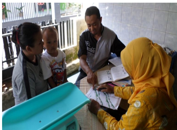
Gambar 10. Tim Pengabdian Melakukan pendampingan saat Deteksi Tumbuh Kembang