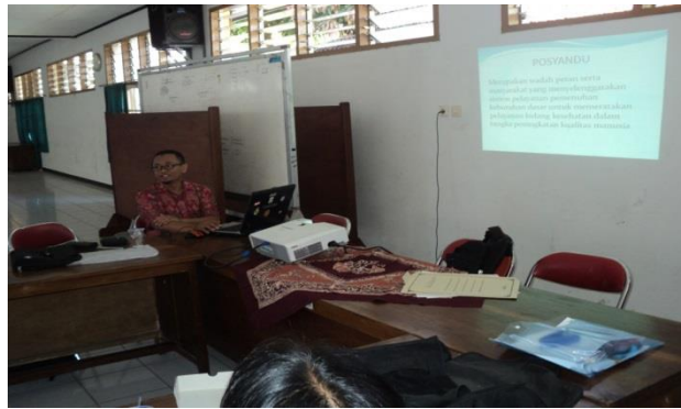
Gambar 1. Ketua Tim Pengabdian menjelaskan tentang Posyandu