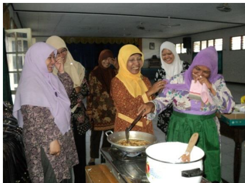
Gambar 4. Kader mendemonstrasikan pembuatan PMT Balita

sumsum kacang ijo, Bahan Nasi tim tahu ati ayam, Nasi tim kacang merah, Bubur semur ayam dan sayuran, Bola tempe saus kuning, Abon ayam suwir, dan Telur dadar tempe.