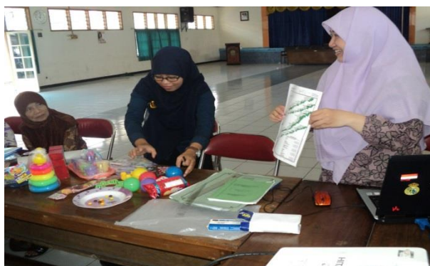
Gambar 3. Anggota Tim Pengabdian 1 dan mahasiswa mendemonstrasikan Deteksi dan Stimulasi Tumbuh Kembang Balita

Pada pelatihan ini akan diajarkan kepada para kader bagaimana cara melakukan stimulasi pertumbuhan dan perkembangan sesuai dengan usia balita yang bersangkutan.