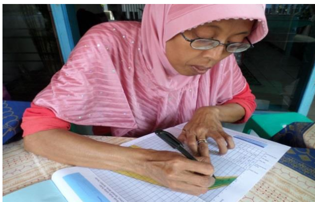
Gambar 9. Kader telah mampu mengisi KMS secara mandiri

Posyandu berjalan setiap bulannya sesuai waktu yang ditetapkan. Pelaksanaan telah mengikuti pelaksanaan sistem 5 meja yang meliputi pendaftaran, penimbangan, pencatatan, pemeriksaan kesehatan dan penyuluhan. Posyandu juga telah memberikan PMT kepada Balita setiap bulannya. Berdasarkan hasil pemantauan dan pendampingan Kader Posyandu telah dapat melakukan pengisian KMS secara mandiri, namun untuk deteksi dan stimulasi tumbuh kembang balita masih perlu bimbingan.