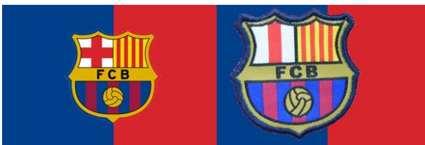
Logo Barcelona Sebelum