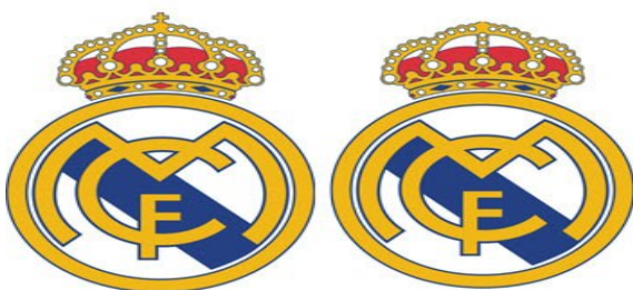
Logo Real Madrid Sebelum