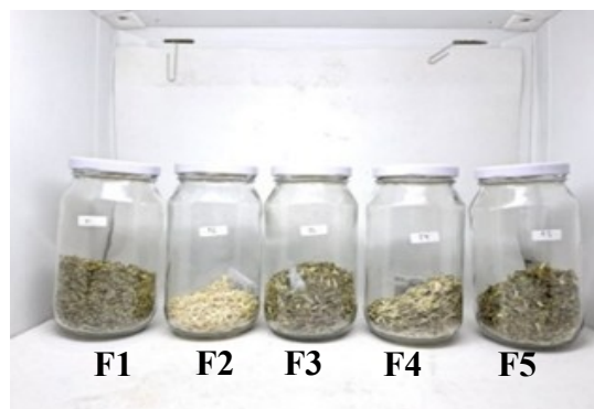
Gambar 1. Visualisasi antar formulasi teh tubruk herbal.

Proses pengeringan daun sirsak dan serai menghasilkan simplisia kering yang seragam dengan karakteristik sensoris yang baik. Secara visual, daun sirsak kering berwarna hijau kecoklatan, sedangkan serai berwarna hijau kekuningan hingga coklat muda, dengan aroma khas masing-masing bahan (Gambar 1). Madu bubuk yang diaplikasikan langsung sebagai pemanis alami dapat meningkatkan cita rasa dan menjaga stabilitas produk kering.