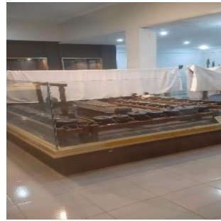
Gbr. 2 Alat Musik Gamelan Sekaten