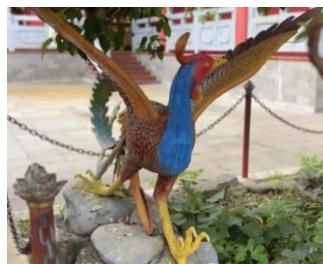
Gambar 8. Patung Burung Hong

Burung Hong dalam konteks kelenteng memiliki makna simbolis yang mendalam, melambangkan keberuntungan, keanggunan, keabadian, dan keseimbangan. Sebagai mitologi, burung ini sering dikaitkan dengan permaisuri, mewakili kelembutan dan keanggunan, serta melambangkan dunia atas atau khayangan.