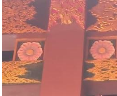
Gambar 3. Bunga Fatma atau bunga teratai

Bunga Fatma atau bunga teratai seringkali digunakan dalam arsitektur-arsitektur bangunan di Indonesia karena bunga ini memiliki makna yang baik. Dalam budaya Jawa, bunga Fatma melambangkan kesucian dan keanggunan. Ornamen bunga Fatma berada pada rooster-rooster di dekat atap pendopo. Ornamen ini digunakan di Kelenteng sebagai simbol spiritual untuk menjaga kesucian tempat ibadah dan hati para pendoa yang datang. Ornamen bunga Teratai berada di atas atap bangunan bermakna kesempurnaan dan kesucian (Wulanningrum, 2019).