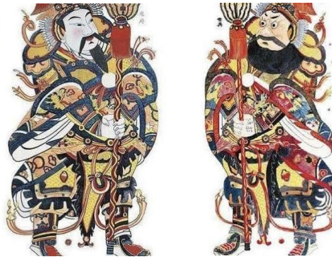
Gambar 7: Qin Shubao (kiri) dan Yuchi Jingdae (kanan)

Kedua tokoh ini sangat dihormati dalam sejarah China karena loyalitas dan keberanian mereka dalam melindungi kaisar. Mereka menjadi simbol kekuatan dan pertahanan, dan sering digambarkan sebagai penjaga di pintu gerbang istana atau dalam bentuk patung di kuil.