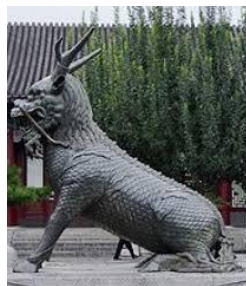
Gambar 6. Patung Kilin

Kilin adalah makhluk mitologis suci Tionghoa yang hanya muncul dalam dua momen penting dalam sejarah Tionghoa yaitu menjelang kelahiran dan saat wafatnya Nabi Konghucu. Kilin sering digunakan sebagai ornamen pada bangunan-bangunan bernuansa Tionghoa. Kilin merupakan perwujudan dari serigala, kambing, sapu kuda dan rusa. Bentuk tubuhnya seperti tubuh rusa dan memiliki tanduk yang panjang di kepalanya, ada segumpal daging pada tanduknya, kakinya seperti kaki kuda dan ekornya seperti ekor sapi. Kilin terbagi menjadi dua jenis kelamin yaitu jantan dan betina, kilin jantan bernama Chi dan kilin betina disebut Li. Hewan ini melambangkan kedamaian, kebajikan, umur panjang dan kemegahandan. Kemunculannya merupakan pertanda hadirnya tokoh agung atau zaman yang makmur. Kehadirannya sebagai ornamen di kelenteng memperkuat nilai-nilai moral dan spiritual dalam ajaran Konghucu.