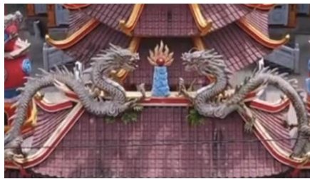
Gambar 1. Patung Nogo

Nogo digambarkan sebagai ular besar yang mengapit atau menjaga mustika, melambangkan keagungan, kekuatan, dan kewibawaan. Dalam tradisi Tionghoa dan Jawa, mustika dianggap sebagai sumber energi suci atau kekuatan langit, dan naga sebagai penjaganya menjadi simbol pelindung yang penuh wibawa. Kedua ornamen patung naga biasa dibangun saling berhadapan.