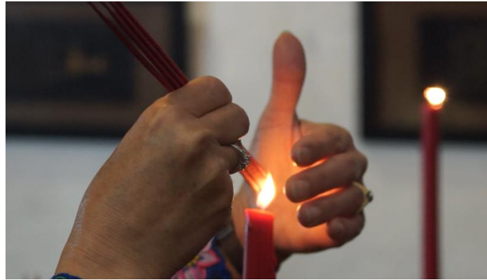
Gambar 1 Upacara pembakaran dupa pada acara pernikahan putri Bapak Udaya Halim