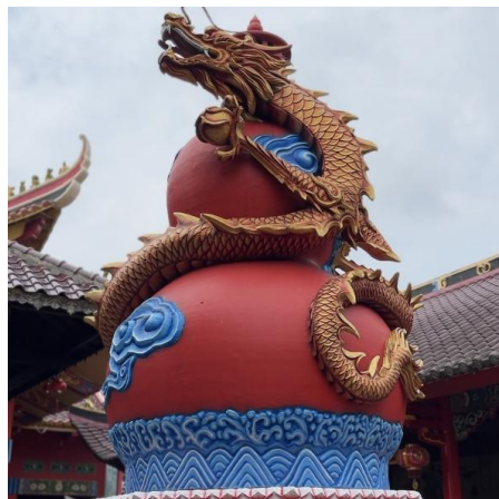
Gambar 4. Patung Naga

Naga merupakan salah satu mitologi China atau Tiongkok yang sangat familiar dan sering digunakan pada arsitektur bangunan bergaya Tionghoa, naga diyakini memiliki napas yang seperti angin, suara naga dianggap sebagai guntur dan dapat menciptakan hujan, karena naga memiliki aktivitas di langit. Patung naga seringkali di