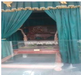
Gbr. 3 Tandu Jempana