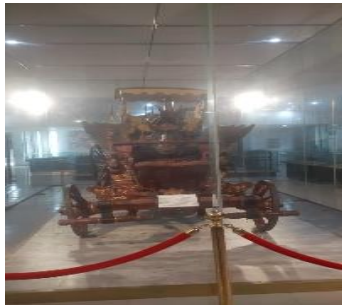
Gbr. 1 Kereta Singa Barong

Museum Pusaka Keraton Kasepuhan Cirebon terdapat benda-benda bersejarah seperti gamelan, rebana, koleksi senjata, baju zirah Portugis, ukiran kayu kuno karya Panembahan Girilaya, kereta Singa Barong dan alat Perangkat Tradisi Turun Tanah. Museum Pusaka Keraton Kasepuhan Cirebon ini memiliki akulturasi budaya dan agama. Salah satunya seperti kereta Singa Barong yang memiliki perwujudan dari tiga binatang yaitu belalai gajah yang melambangkan persahabatan dengan negara India yang beragama Hindu, kepala naga melambangkan persahabatan dengan negara China yang beragama Budha, sayap dan badan mengambil dari Buroq yang melambangkan persahabatan dengan negara Mesir yang beragama Islam.