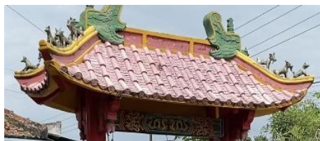
Gambar 2. Atap Limasan dengan ornamen Patung Nogo

Struktur atap berbentuk limas dengan empat sisi yang meruncing ke atas seperti Piramida. Atap limasan pada dasarnya merupakan salah satu jenis struktur atap yang digunakan pada rumah adat Jawa, bentuk atap ini terdiri dari empat bidang atap yang memiliki bentuk trapesium sama kaki dan di bagian kiri kanannya berbentuk segitiga sama kaki. Pada zaman dahulu, atap limasan digunakan oleh masyarakat Jawa dengan ekonomi sedang. Struktur atap limasan pada Kelenteng ini mencerminkan akulturasi antara budaya lokal (Jawa) dengan arsitektur Tionghoa. Atap ini berbentuk limas dengan empat sisi yang meruncing ke atas, menyerupai piramida. Bentuk ini melambangkan kestabilan, keterbukaan, dan keseimbangan antara dunia atas dan dunia bawah.