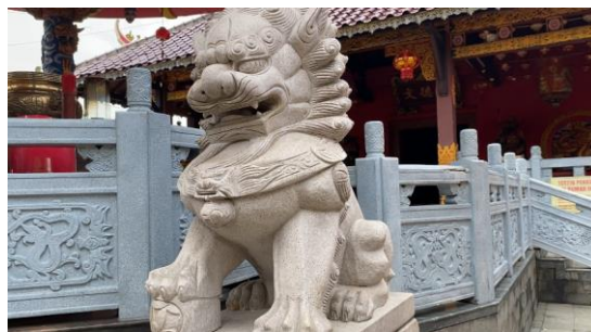
Gambar 5. Patung Barongsai

Dalam kepercayaan konghucu, barongsai merupakan ikon perlindungan dan pengusir bala dalam tradisi Tionghoa sehingga barongsai sering kali diadakan di acara Imlek dan perayaan lainnya. Kelenteng Boen Tek Bio mempunyai lima pasang patung Barongsai yang ditempatkan sebagai simbol tolak bala. Menurut legenda, Barongsai merupakan mitologi masyarakat Tionghoa kuno yang diciptakan untuk mengusir monster yang mengganggu masyarakat desa, Keberadaan Barongsai dilatarbelakangi oleh sosok Nian yang selalu mendatangi desa pada masa itu.