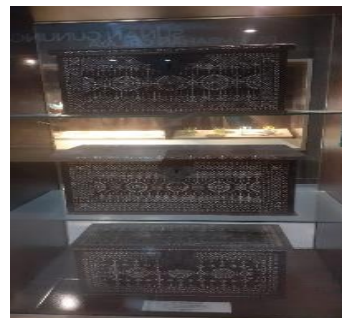
Gbr. 4 Peti Mesir Dokumen Delvin

Gambar 1 adalah gambar kereta Singa Barong yang merupakan simbol dari persahabatan antara negara Indonesia, India, Mesir, dan China. Kereta Singa Barong memiliki arti dalam bahasa Cirebon yaitu Sing Ngarani dan barong, singkatan ini memiliki arti bersama-sama. Kereta Singa Barong mempunyai perwujudan tiga hewan. belalai gajah yang melambangkan negara India dan beragama Hindu, kepala dan tanduk naga yang melambangkan negara China dan agama Budha, bentuk sayap dan badannya berbentuk Buroq yang melambangkan kebudayaan Islam.