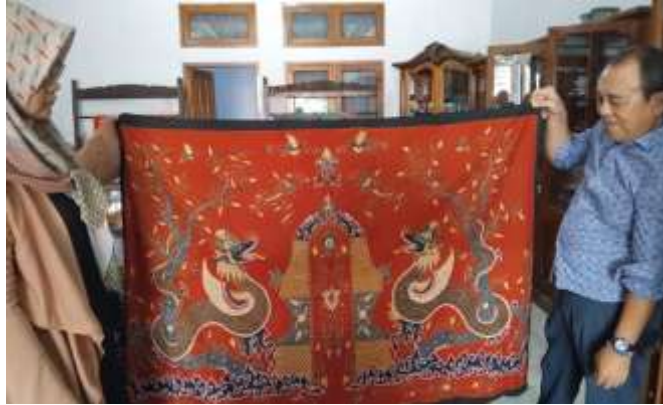
Gambar 4.7 Batik desa Trusmi dengan perpaduan motif Tionghoa

Salah satu motif batik yang bernuansa perpaduan antara motif Trusmi Cirebon dengan dengan motif Tionghoa diperoleh secara langsung. Unsur Trusmi Cirebon tampak pada penggunaan motif mega mendung dan gerbang keraton, sedangkan unsur Tionghoa diwujudkan melalui gambar naga yang saling berhadapan dengan ornamen dedaunan. Warna dasar merah tua mencerminkan kekhasan budaya Tionghoa yang dipadukan dengan warna hijau dan sentuhan keemasan.