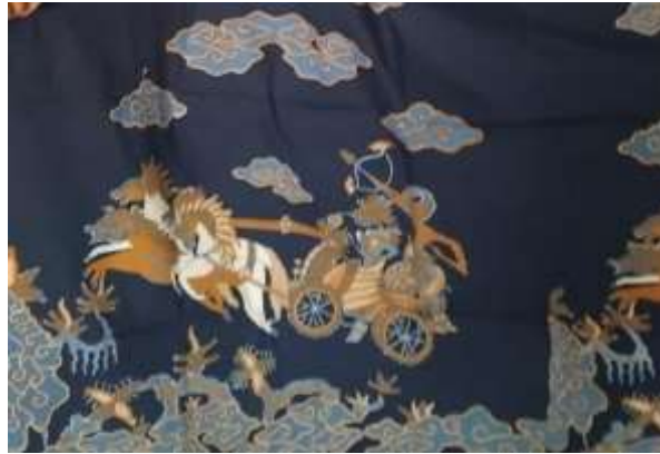
Motif batik Paksi Naga Liman