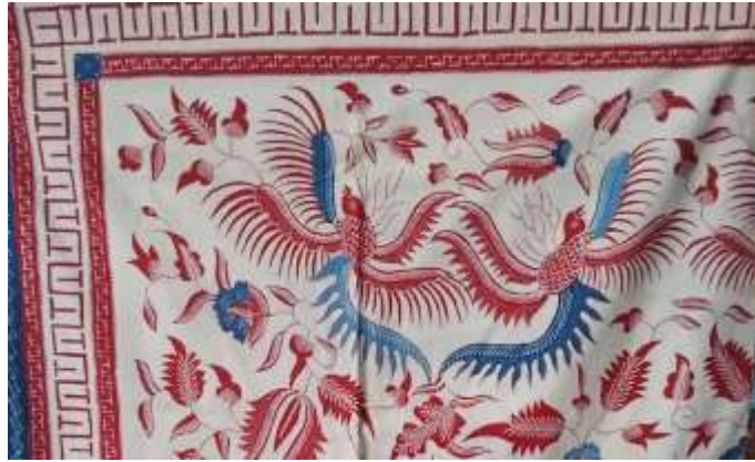
Gambar 4.6 Motif Batik Asli Tionghoa

Motif ini dinamakan dengan motif burung Phoenix dengan perpaduan dedaunan dan warna dasar yang cerah. Ciri khas batik Tionghoa adalah penggunaan warna-warna yang cerah dan motif yang kaya. Warna-warna seperti merah tua, emas, putih atau krem adalah warna yang sering digunakan. Sebagaimana menurut Xiao Fei fei atau yang akrab dengan nama Olivia (2020) bahwa warna yang digunakan pada batik Tionghoa tentunya memiliki arti tertentu, serta produknya juga mempunyai arti filosofis seperti banji (lambang kebahagiaan), dan kelelawar (lambang nasib baik). Adapun filosofis burung phoenix menurut Raharjo (2025) bahwa burung tersebut bermakna keberuntungan.