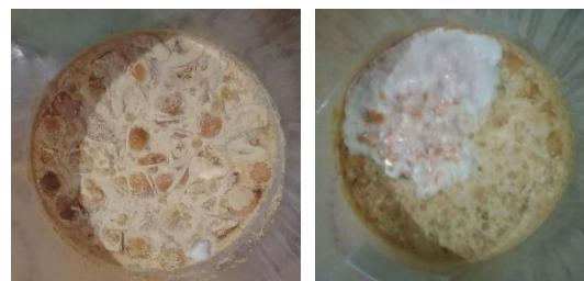
Gambar 1. Eco-enzyme 1 Gambar 2. Eco-enzyme 2