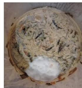
Gambar 3. Eco-enzyme 3

Penelitian ini menunjukkan bahwa setelah fermentasi selama 3 bulan, eco-enzyme mengalami perubahan warna pada setiap wadahnya. Wadah pertama menunjukkan warna agak kuning kecoklatan