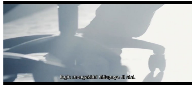
Sumber: Film "12 Suicidal Teens" Karya Yukihiro Tsutsumi Gambar 4. Scene 2 Menit (1:30:33)