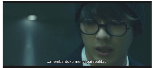
Sumber: Film "12 Suicidal Teens" Karya Yukihiro Tsutsumi Gambar 7. Scene 3 Menit (1:40:06)