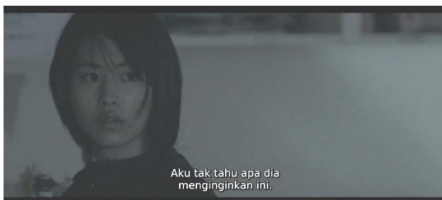
Sumber: Film "12 Suicidal Teens" Karya Yukihiro Tsutsumi Gambar 3. Scene 2 Menit (1:30:26)

Dalam membuat keputusan, diperlukan proses pertimbangan secara panjang dan matang. Keputusan yang dibuat tanpa pertimbangan panjang dan matang dapat merugikan diri sendiri dan orang di sekitar kita. Tidak hanya proses yang panjang dan matang, pendapat atau pandangan orang lain pun perlu ikut serta dipertimbangkan jika keputusan tersebut menyangkut juga menyangkut orang lain. Dalam hal ini, Yuki semata-mata hanya memikirkan kemauannya saja tanpa mempertimbangkan kemauan kakaknya, walaupun kakak Yuki berada dalam keadaan koma, yang belum tentu bisa menyampaikan pendapatnya sendiri. Keputusan Yuki yang hanya setengah-setengah ini pun menjadi rumit ketika kakaknya ditemukan oleh tokoh lainnya dan nyaris membuat Yuki mengakhiri hidupnya bersama-sama.