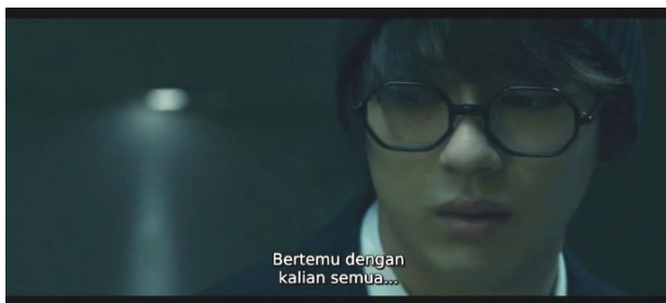
Sumber: Film "12 Suicidal Teens" Karya Yukihiro Tsutsumi Gambar 6. Scene 3 Menit (1:40:05)

Ketika mengalami nasib buruk dalam hidup, tidak jarang kita akan merasa amat terpuruk. Namun, seberapa buruk nasib yang kita alami, kita harus tetap bertahan hidup. Dalam hal ini, semua tokoh pada film "12 Suicidal Teens" mengalami nasib buruk dalam hidupnya dengan caranya masing-masing, mulai dari menjadi korban perundungan, permasalahan dengan orang tua, bahkan mengidap penyakit yang sulit disembuhkan. Tetapi, ketika masing-masing anggota mulai mengenal satu sama lain dan membuka diri secara perlahan, keinginan untuk mengakhiri hidup tersebut mulai memudar dan kembali optimis melanjutkan hidup.