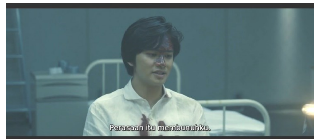
Gambar 1. Scene 1 Menit (1:11:18)

Sumber: Film "12 Suicidal Teens " Karya Yukihiiko Tsutsumi