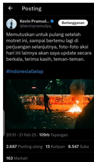
Gambar 3. Postingan visual dari akun @kevinpramudya_ yang menampilkan suasana demonstrasi malam hari dengan latar api dan mural protes.