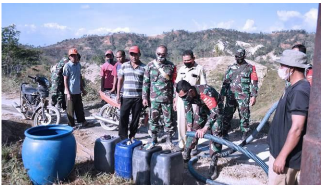
Gambar 2. Bantuan air bersih saat musim kemarau tahun 2020 bagi warga Dusun Kayu Bima Desa Petir Kecamatan Purwanegara Kabupaten Banjarnegara.

Selain menyimpan potensi wisata, Desa Petir termasuk salah satu desa yang sering mengalami kekeringan pada saat musim kemarau, apalagi jika terjadi masa kemarau panjang. Badan Penanggulangan Bencana Daerah (BPBD) Kabupaten Banjarnegara menginformasikan setidaknya ada 15 desa di Kabupaten Banjarnegara yang telah terdampak kekeringan dan mengalami krisis air bersih. Desa-desanya tersebut antara lain adalah Desa Petir, Desa Kalitengah, Desa Karanganyar, Desa Kaliajir, dan Desa Merden Kecamatan Purwanegara; Desa Karangjati Kecamatan Susukan; Desa Kebutuhjurang, Desa Kebutuhduwur, Desa Lebakwangi, dan Desa Duren, Kecamatan Pagedongan; Desa Jalatunda, Desa Somawangi Kecamatan Mandiraja; Desa Sirkandi Kecamatan Purwareja Klampok; Desa Kebondalem Kecamatan Bawang; dan Desa Ampelsari Kecamatan Banjarnegara [2]. Sebagai antisipasi, di beberapa desa tersebut telah mulai dibuat instalasi air minum desa dengan memanfaatkan sumber-sumber air tanah yang ada hingga pembuatan sumur bor. Dengan demikian, pemerintah berharap masalah kekeringan di Banjarnegara dapat teratasi. Gambar 2 menunjukkan bantuan air bersih dari Dandim 0704 Banjarnegara saat musim kemarau tahun 2020 bagi warga Dusun Kayu Bima Desa Petir Kecamatan Purwanegara Kabupaten Banjarnegara [3].