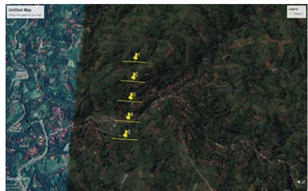
Gambar 3. Desain akuisisi data resistivitas di Masjid At-Taqwa Desa Petir Kecamatan Purwanegara Kabupaten Banjarnegara.

Wilayah Desa Petir Kecamatan Purwanegara Kabupaten Banjarnegara berada di luar kawasan Cekungan Air Tanah (CAT), sehingga untuk mengestimasi kedalaman sumur bor diperlukan survei geolistrik. Kegiatan PKM diawali dengan pelaksanaan survei geolistrik di beberapa titik sounding di sekitar Masjid At-Taqwa Desa Petir dengan desain akuisisi seperti Gambar 3. Survei ini bertujuan untuk mendapatkan log resistivitas batuan. Selanjutnya log resistivitas batuan itu diinterpretasi secara litologi, sehingga diperoleh log litologi batuan bawah permukaan yang menunjukkan urutan batuan secara vertikal termasuk lapisan akuifer air tanah. Peralatan yang digunakan dalam survei geolistrik dapat dilihat pada Tabel 1.