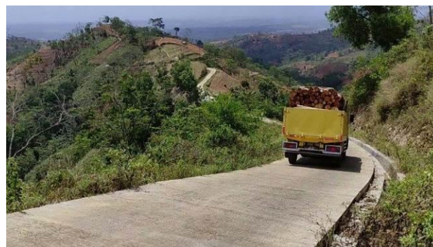
Gambar 1. Salah satu panorama Desa Petir Kecamatan Purwanegara Kabupaten Banjarnegara.

Teritis dan Puncak Anjir di Dusun Kayubima. Panorama Desa Petir dapat dilihat pada Gambar 1 [1].