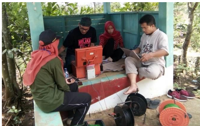
Gambar 4. Kegiatan akuisisi data geolistrik resistivitas di sekitar Masjid At-Taqwa Grumbul Ketarangan, Desa Petir, Kecamatan Purwanegara, Kabupaten Banjarnegara.

Survei geolistrik telah dilakukan pada lima titik sounding yang tersebar di sebelah utara dan selatan Masjid At-Taqwa Grumbul Ketarangan, Desa Petir, Kecamatan Purwanegara, Kabupaten Banjarnegara. Dari lima titik sounding tersebut, kegiatan pengeboran sumur hanya dilakukan di titik ketiga dengan posisi geografis 7^{\circ}28'52.34'' LS dan 109^{\circ}35'24.13'' BT. Secara visual kegiatan lapangan survei geolistrik yang telah dilakukan oleh tim PKM yang terdiri atas dosen dan mahasiswa Program Studi Fisika FMIPA UNSOED dapat dilihat pada Gambar 4.