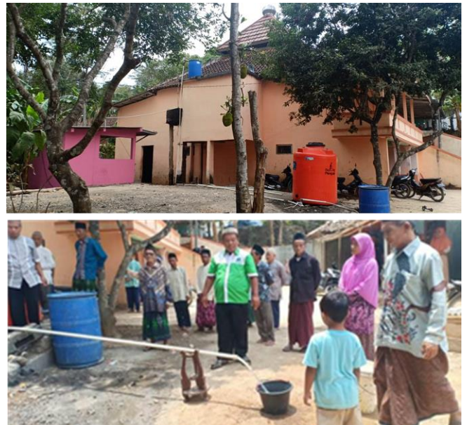
Gambar 8. Air sumur hasil pengeboran di kompleks Masjid At-Taqwa, Desa Petir, Kecamatan Purwanegara, Kabupaten Banjarnegara dengan debit yang relatif kecil.

Berdasarkan Gambar 7, hasil log resistivitas mempunyai kedalaman yang berbeda dengan hasil log bor. Perbedaan kedalaman masing-masing batuan antara dua jenis data ini dapat dipahami, mengingat posisi dan elevasi titik sounding resistivitas berbeda dengan titik sumur bor. Titik sumur bor berada di selatan titik sounding resistivitas dengan jarak \pm 50 meter dan elevasinya lebih tinggi \pm 10 meter. Selain itu, perbedaan tersebut juga dapat terjadi akibat faktor dinamika batuan yang mengalami berbagai peristiwa geologi, seperti longsor, tanah bergerak, sesar, dan sebagainya. Berdasarkan hasil pemodelan dan interpretasi data resistivitas, ditemukan lapisan yang mempunyai nilai resistivitas 16,49 \Omega m pada kedalaman 65,18 - 86,97 meter. Lapisan ini diperkirakan sebagai akuifer lokal di kawasan tersebut. Setelah dikorelasi dengan data log bor, diketahui bahwa lapisan ini tersusun atas kerikil dan kerakal. Kerikil dan kerakal merupakan media yang cukup baik sebagai material akuifer [9].