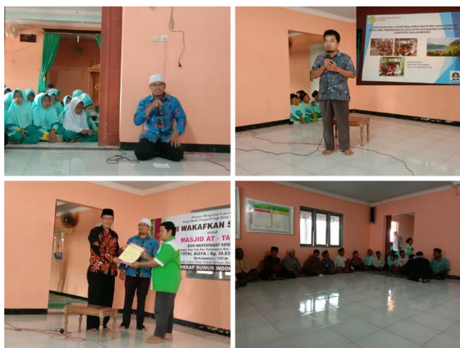
Gambar 9. Kegiatan sosialisasi hasil survei geolistrik dan serah terima sumur di Masjid At-Taqwa Desa Petir, Kecamatan Purwanegara, Kabupaten Banjarnegara.

Kegiatan sosialisasi hasil survei geolistrik dan korelasinya dengan hasil pengeboran sumur oleh dosen telah dilakukan bersama dengan penyerahan sumur oleh komunitas Wakaf Sumur Indonesia (WSI) selaku mitra kegiatan PKM kepada khalayak sasaran. Keberhasilan kegiatan PKM, selanjutnya diobservasi melalui wawancara dan pengamatan langsung [10]. Wawancara telah dilakukan kepada khalayak sasaran khususnya takmir dan jamaah Masjid At-Taqwa Desa Petir Kecamatan Purwanegara Kabupaten Banjarnegara pada saat pelaksanaan sosialisasi oleh dosen serta serah terima sumur oleh tim WSI. Selain melalui wawancara, keberhasilan PKM juga diobservasi secara langsung di lokasi kegiatan. Hal ini dilakukan untuk memonitor penggunaan sumur, perawatan, dan pemanfaatannya oleh khalayak sasaran. Secara umum, item-item observasi melalui wawancara tersebut dirangkum dalam Tabel 2. Sedangkan item-item observasi keberhasilan melalui pengamatan langsung dapat dilihat pada Tabel 3. Berdasarkan hasil observasi yang dirangkum dalam tabel-tabel tersebut, kegiatan PKM yang dilaksanakan oleh dosen Fisika UNSOED dengan mitra dari komunitas Wakaf Sumur Indonesia (WSI) telah berhasil baik.