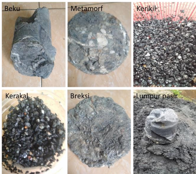
Gambar 6. Jenis-jenis batuan bawah permukaan yang berhasil diangkat ke permukaan saat pengeboran sumur di kompleks Masjid At-Taqwa Desa Petir, Kecamatan Purwanegara, Kabupaten Banjarnegara.

Hasil interpretasi dalam bentuk log litologi ditindaklanjuti dengan melakukan pengeboran sumur di kompleks Masjid At-Taqwa Desa Petir, Kecamatan Purwanegara, Kabupaten Banjarnegara. Proses pengeboran cukup berat, karena harus menembus batuan beku, batuan metamorf, lapisan kerikil dan kerakal, serta batuan breksi. Pengeboran sumur berhasil dilakukan hingga kedalaman 100 m. Jenis batuan bawah permukaan yang berhasil diangkat hingga ke permukaan ditunjukkan pada Gambar 6. Perbandingan log litologi hasil pengukuran geolistrik dan hasil pengeboran dapat dilihat pada Gambar 7. Hasil pengeboran menghasilkan air tanah dengan debit yang relatif kecil, namun masih cukup untuk memenuhi kebutuhan air di masjid dan sebagian warga yang tinggal di sekitarnya seperti terlihat pada Gambar 8.